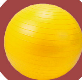
瑜伽球 (65公分, 不帶刺)